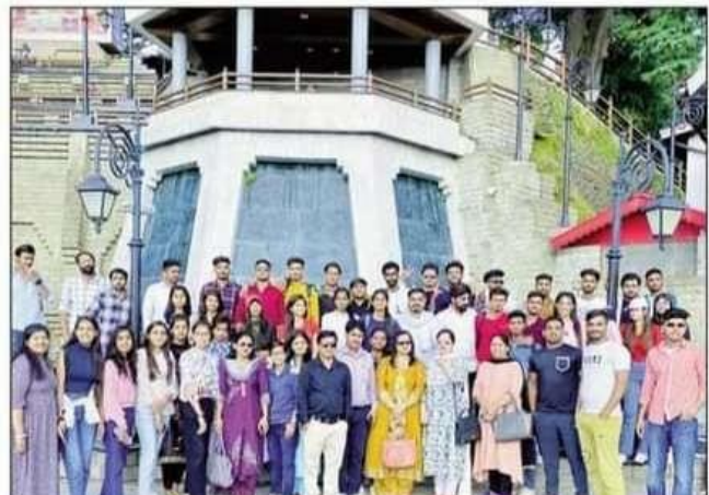
महाविद्यालय के विद्यार्थी भ्रमण के दौरान स्टाफगण के साथ।

उसके बाद विद्यार्थियों ने जाखू मंदिर के दर्शनकिए जिसका अपना ही धार्मिक महत्व है, फिर शिमला स्टेट