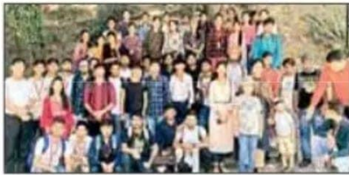
शैक्षणिक भ्रमण के दौरान विद्यार्थी।

कैथल (प्रदीप हरित) : आर.के.एस.डी. कालेज के अर्थशास्त्र विभाग के विद्यार्थियों ने कसौली, हिमाचल प्रदेश एवं चंडीगढ़ का एक दिवसीय शैक्षणिक भ्रमण किया। डा. विरेंद्र