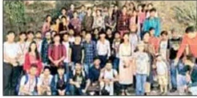
शैक्षणिक भ्रमण के दौरान विद्यार्थी।