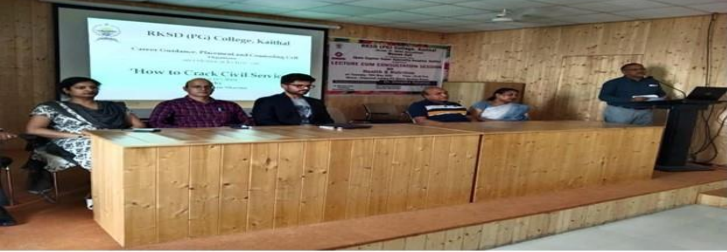
Date: 11 May 2022

Extension Lecture on "How to Crack Civil Services"