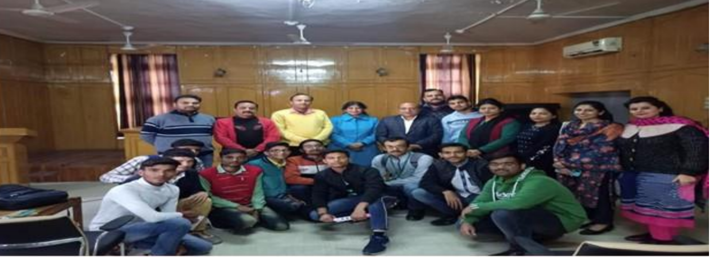
Date: 08 December 2021

Extension Lectures on "Career Opportunities in IT"